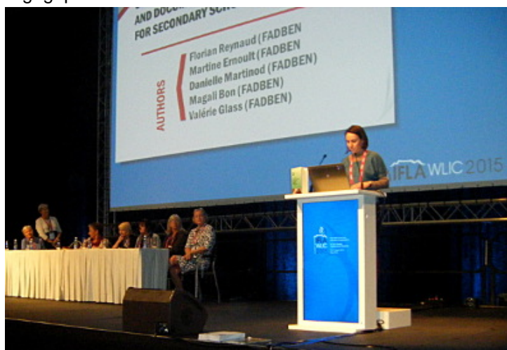
V. Glass pour la FADBEN - IFLA WLIC 2015

La tenue de ces deux congrès a été l'occasion de promouvoir le livre publié par DeGruyter et l'IFLA, intitulé Global Action on School Library Guidelines , livre en relation avec la mise à jour de l' IFLA/UNESCO School Library Guidelines , dont la première édition est parue en 2002. Ce livre rassemble des chapitres avec des exemples d'actions menées illustrant les différentes parties du School Library Guidelines . La FADBEN y a contribué en rédigeant un chapitre intitulé " Developing a curriculum in information and documentation for secondary schools in France " (" Pour un curriculum en information-documentation dans l'enseignement secondaire en France ") dans la partie consacrée au rôle pédagogique d'une bibliothécaire scolaire.