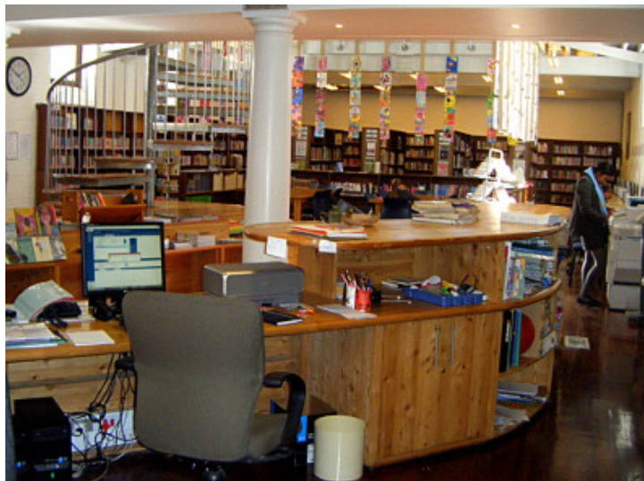
Visite d'une bibliothèque au Cap

Le groupe de congressistes IFLA a été particulièrement bien accueilli dans les deux écoles des townships , par le chef d'établissement comme par les élèves, qui ont été ravis d'expliquer ce qu'ils faisaient dans leur bibliothèque.