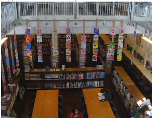
Visite d'une bibliothèque au Cap

La FADBEN a également été retenue pour présenter le poster professionnel " Pour un curriculum info-documentaire de la maternelle à l'université ". La présentation de ce poster était accompagnée de marque-pages en français et en anglais, qui ont été mis à disposition des organisateurs, contributeurs et participants à divers moments du congrès (Vous pouvez retrouver ces deux supports en documents joints à cet article, en bas de page).