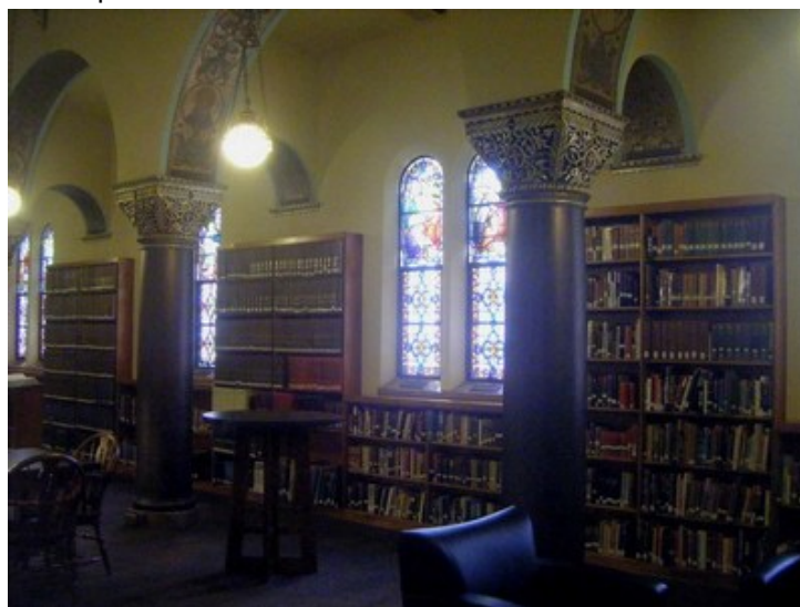
St Charles Preparatory School, Columbus, USA.

L'après-midi le groupe a été accueilli à Columbus dans un lycée privé catholique pour garçons, St Charles Preparatory School, avec une bibliothèque scolaire installée dans une ancienne chapelle. Dotée d'un fonds documentaire riche rassemblant notamment des ressources documentaires patrimoniales, cette bibliothèque est aussi le cadre d'activités pédagogiques quotidiennes menées seul ou en collaboration par un professionnel qui travaille avec les enseignants disciplinaires.