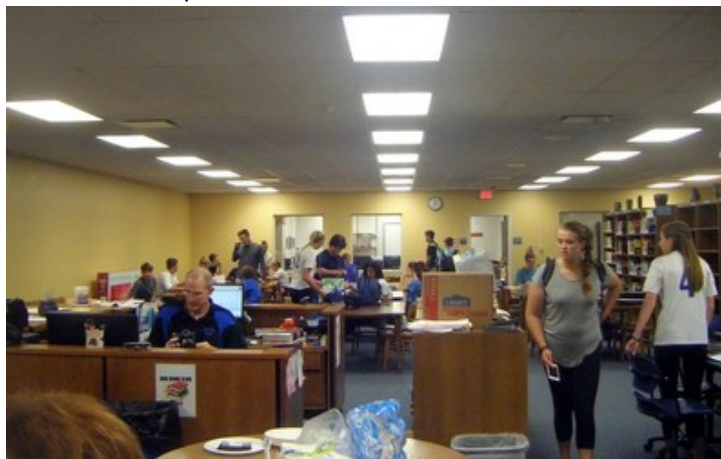
Bexley City Schools (high school), Columbus.

Les deux bibliothèques scolaires visitées le matin sont localisées à Bexley, dans la banlieue de Columbus, et celle visitée l'après-midi à Columbus. Nous avons également visité « virtuellement », via une présentation par vidéo-conférence, une quatrième bibliothèque scolaire située à Westerville dans l'Ohio.