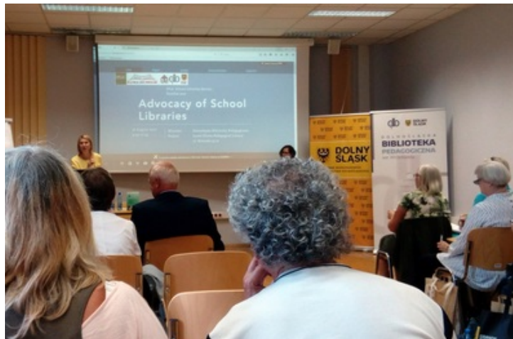
Congrès IFLA - conférence satellite, 18 août 2017

Cette année, à Wroclaw, l'A.P.D.E.N., a participé à une conférence satellite en amont du congrès, le vendredi 18 août 2017, au sein de la bibliothèque pédagogique de Basse Silésie (Wroclaw) , ainsi qu'aux sessions ordinaires qui se sont tenues au cours de la semaine du 19 au 25 août 2017.